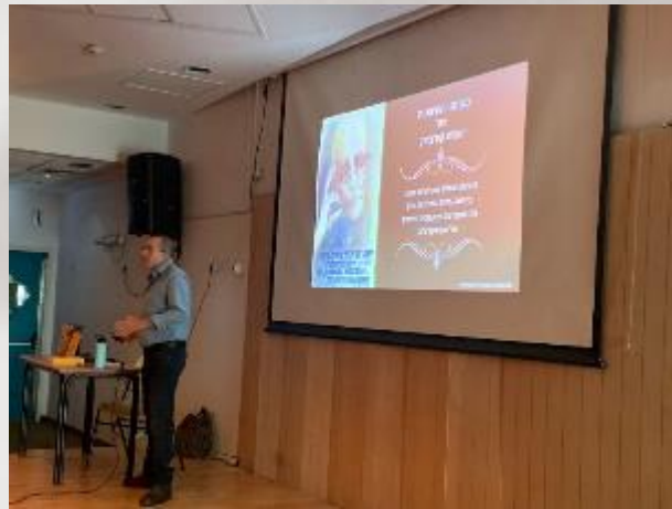
תערוכה מודדת "ניצולי לנינגרד"